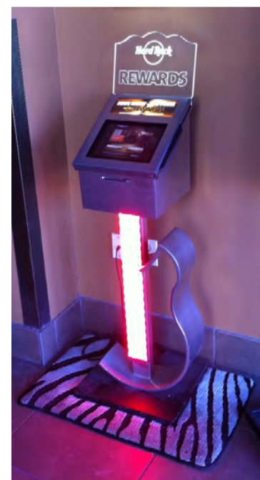
Loyalty Kiosk ®

Hard Rock Café ce n'est pas du bruit, c'est du son : il faut sonoriser, offrir une écoute de qualité mais pas seulement. La technologie et l'acoustique ont fait de grands progrès. Le Hard Rock Marseille offrira le meilleur de la musique en HD. Le Café sera équipé d'un Rock Solo ® , pour petits et grands, où l'on pourra retrouver l'ensemble de la plus grande collection d'objets Rock'n'Roll au monde. Un autre Loyalty Kiosk ® invitera les clients à s'inscrire directement dans le programme de fidélité de la marque et à récupérer immédiatement leurs cartes. Un programme Server AVDJ HRI leur permettra de choisir leurs clips vidéo et morceaux préférés pendant le repas. Des écrans HD restitueront l'image pendant que le partenaire Bose distillera le son. La lumière est aussi un élément majeur du décor : ré-éclairer, donner de la lumière et changer cette lumière plusieurs fois par jour et par zone en fonction des moments est un exercice très difficile.