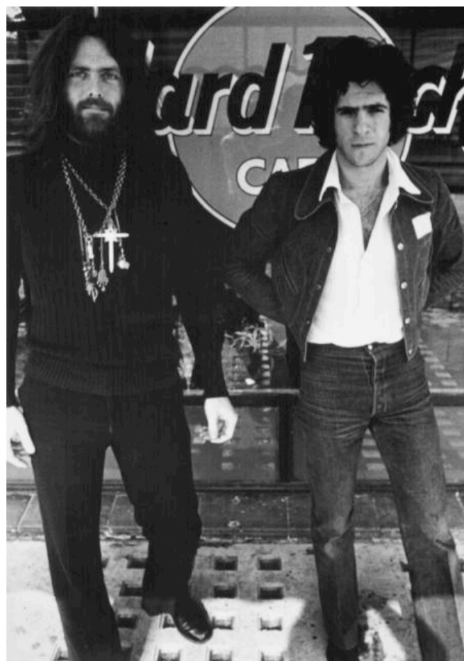
ERIC CLAPTON & PETE TOWNSHEND

Le restaurant devient rapidement populaire et bientôt certains grands noms du rock anglais s'y pressent. Un jour, Eric Clapton, demande au serveur d'accrocher sa guitare au mur afin de marquer « son » tabouret. Une semaine plus tard, le café reçoit un second colis contenant la guitare de Pete Townshend, le leader des Who, avec une note disant « La mienne vaut bien la sienne ! Amitiés, Pete. » Depuis, des centaines d'artistes ont enrichi cette collection en faisant don d'objets cultes, aujourd'hui exposés dans tous les établissements de Hard Rock International à travers le monde.